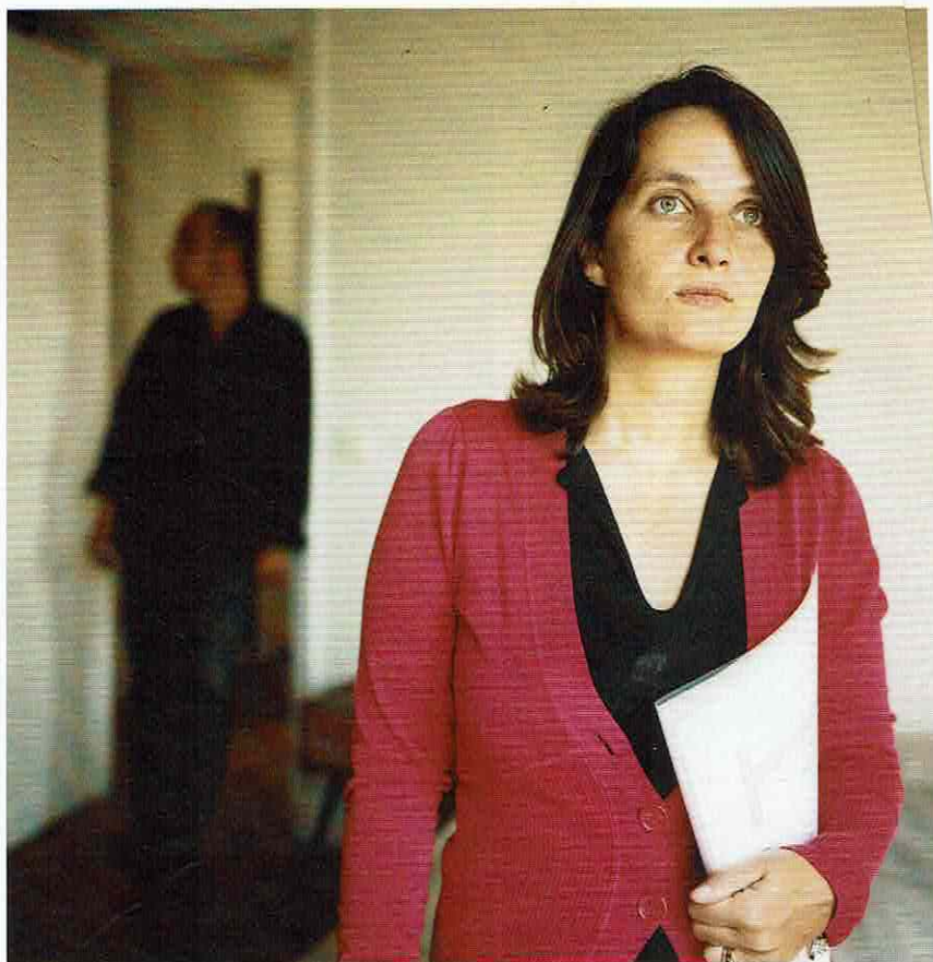
Acheter à deux oblige à se confronter à mille questions, sur soi et sur l'autre.