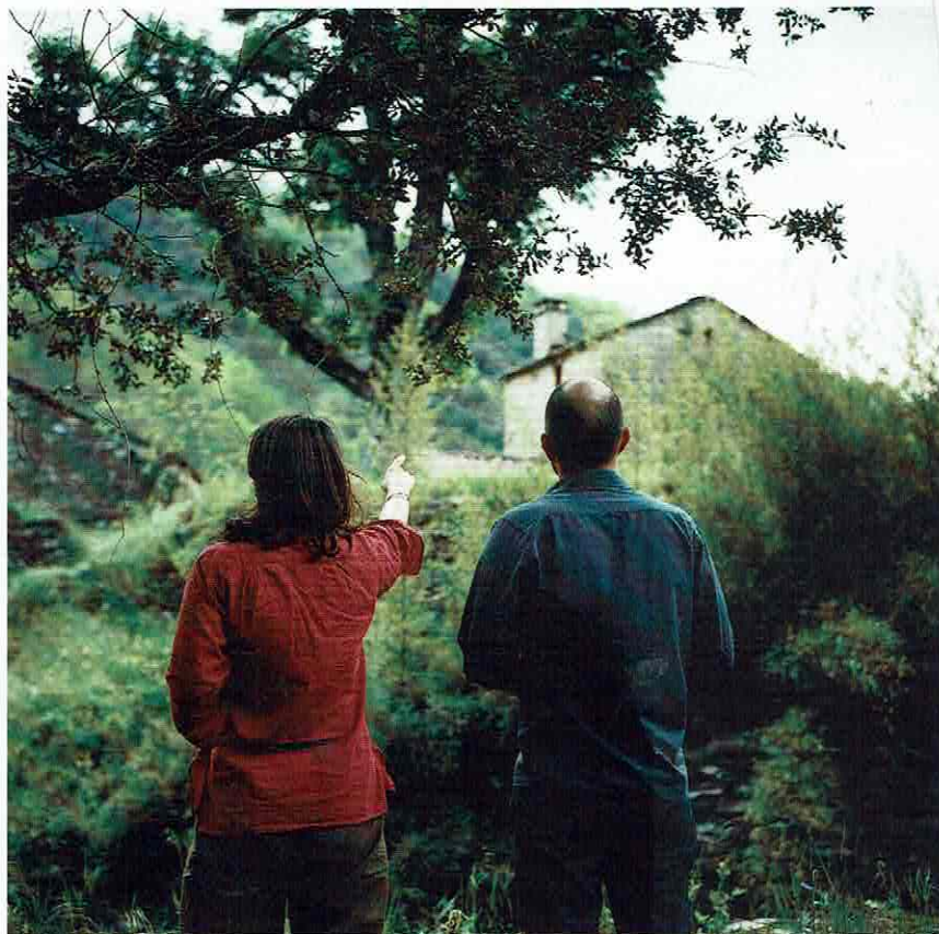
La maison, bien plus chargée symboliquement qu'un simple appartement.