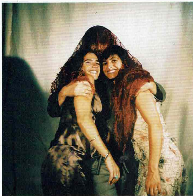
« Ils vous aiment malgré vos défauts. » (Violette)